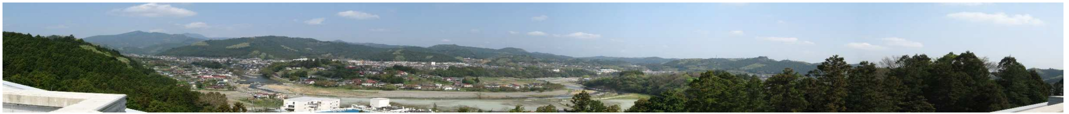
施設屋上から撮影